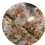
Caída de Pétalos